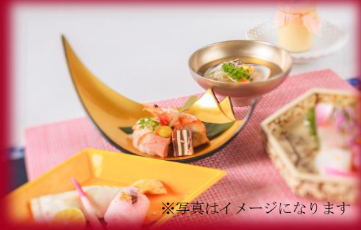
※写真はイメージになります